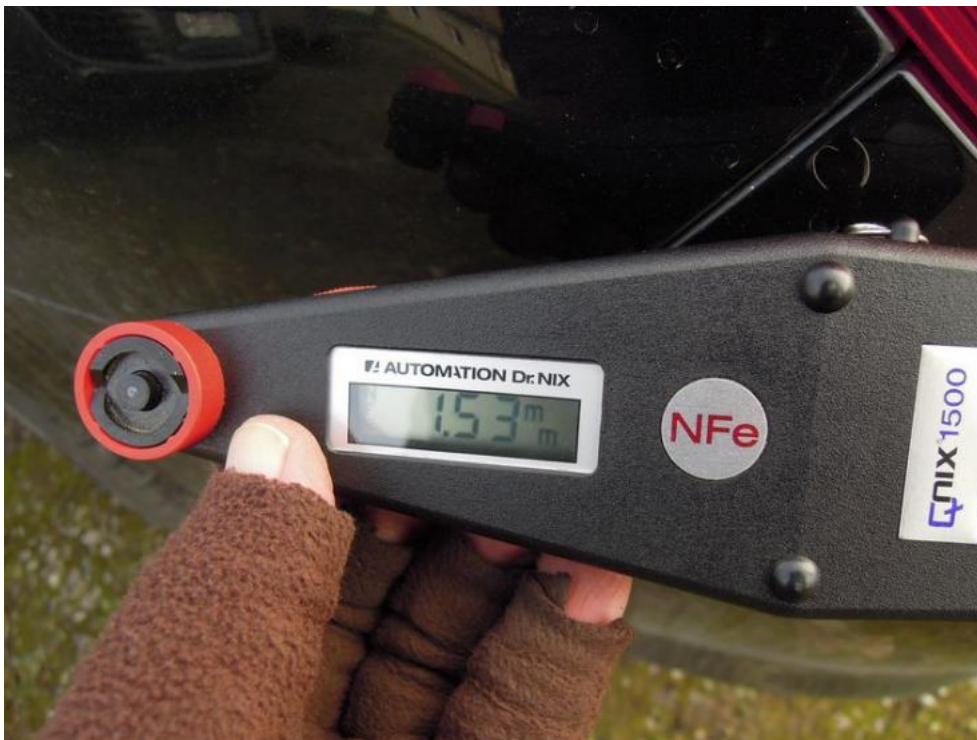
Fot. 15. błotnik TL