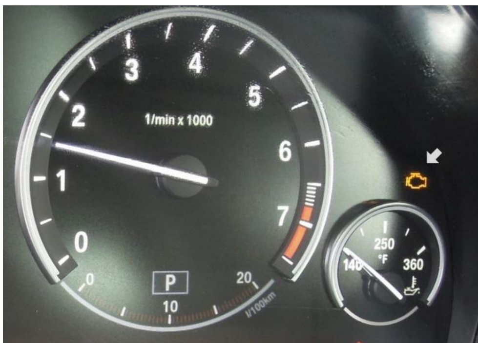
Fot. 14. sygnalizacja błędu