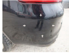
Fot. 21 Zderzak T