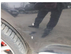
Fot. 29 Drzwi TP