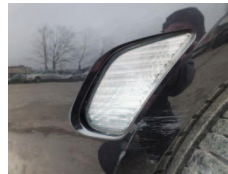
Fot. 23 Światło w zderzaku P