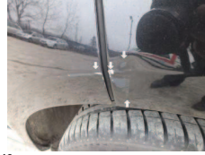
Fot. 19 Drzwi TL błotnik TL