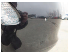
Fot. 27 Zderzak P