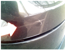
TAILGATE : SCRATCHED