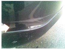
BUMPER REAR : SCRATCHED