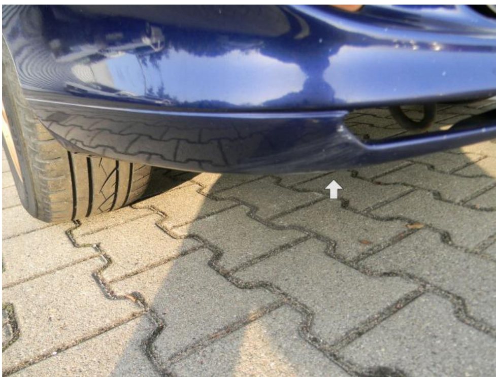
Fot. 23. zderzak P