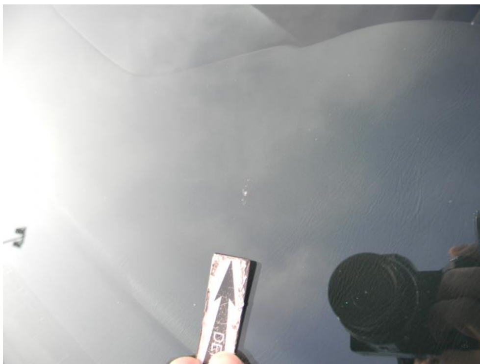
Fot. 33. szyba P