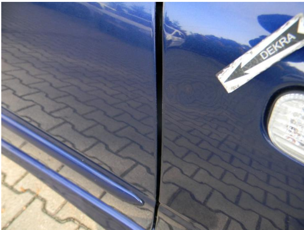
Fot. 25. błotnik PP