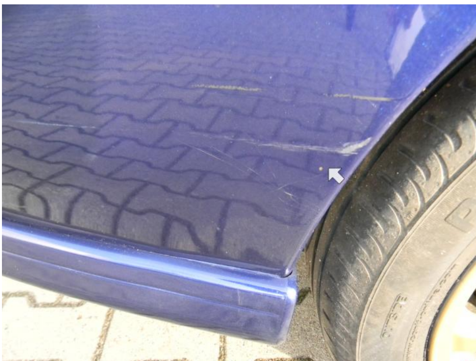
Fot. 16. zderzak T