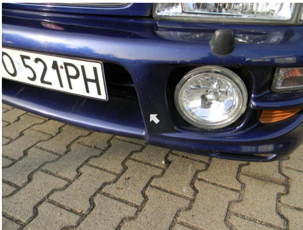
Fot. 21. zderzak P