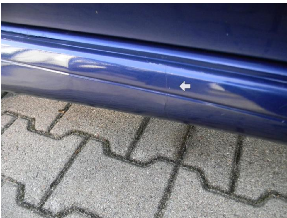
Fot. 20. próg L