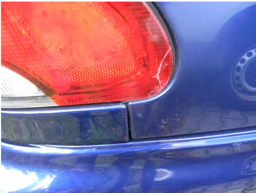
Fot. 29. lampa TP