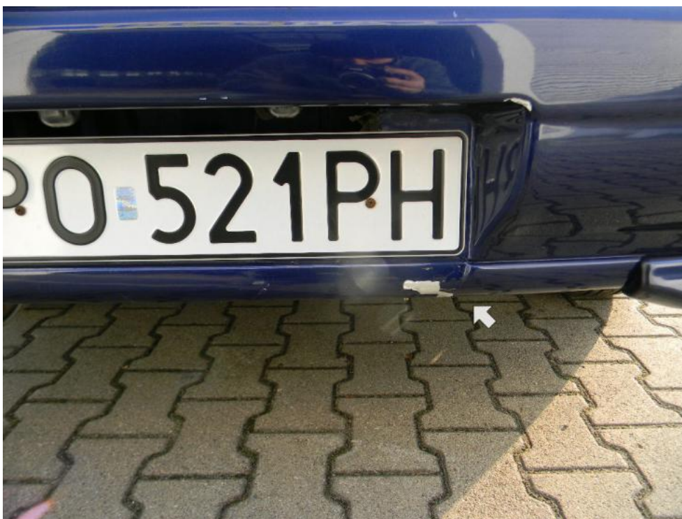
Fot. 17. zderzak T