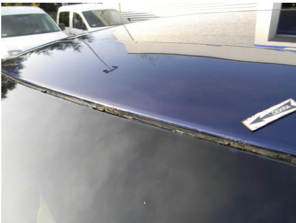
Fot. 30. dach