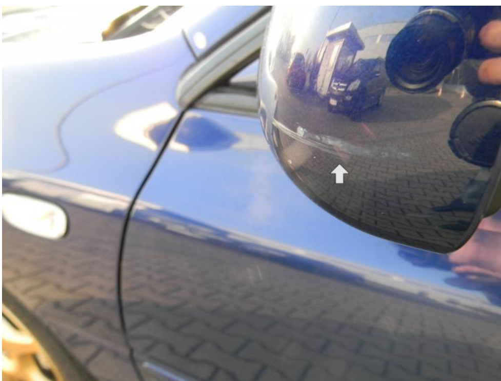
Fot. 24. lusterko L