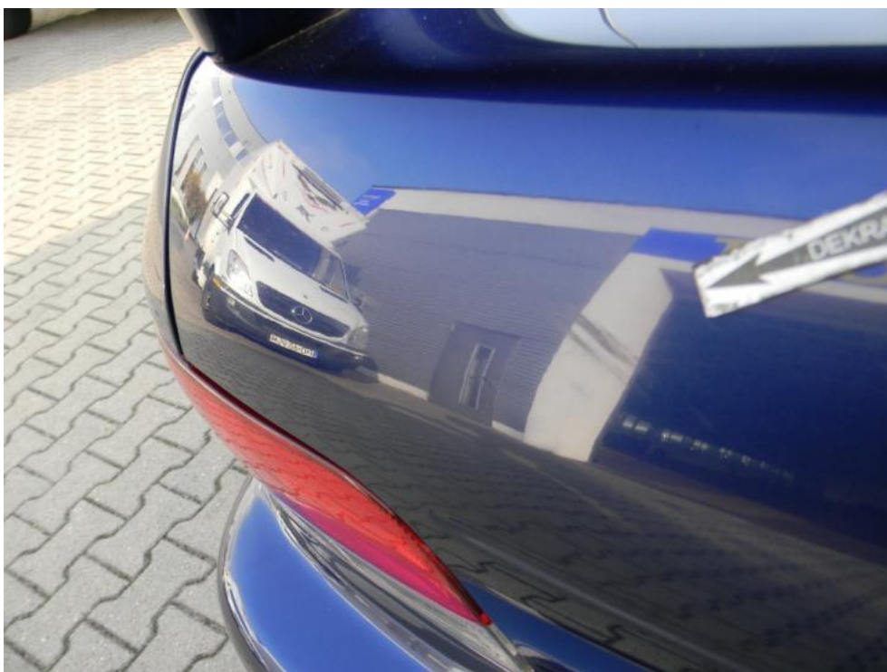
Fot. 28. błotnik TP