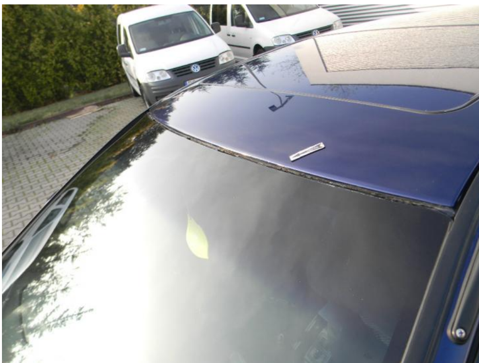
Fot. 32. uszczelka szyby P