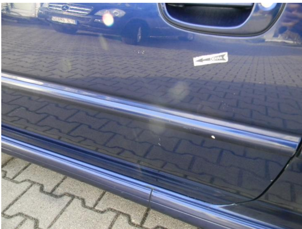
Fot. 19. drzwi L