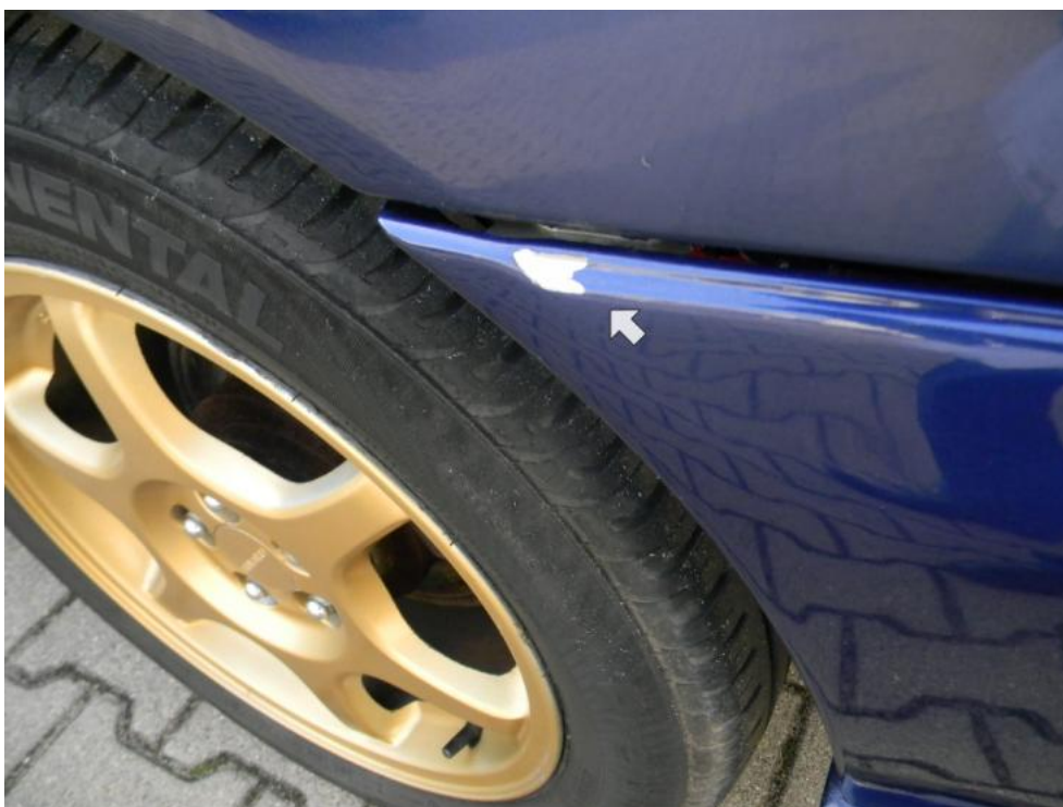
Fot. 18. zderzak T