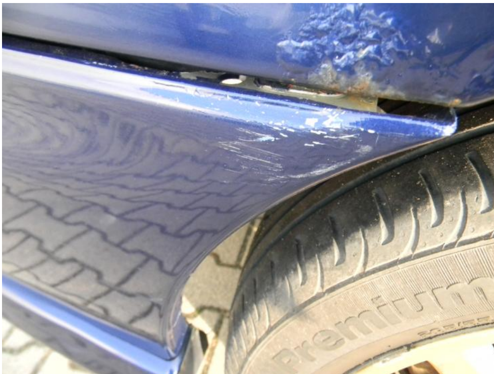
Fot. 27. błotnik TP