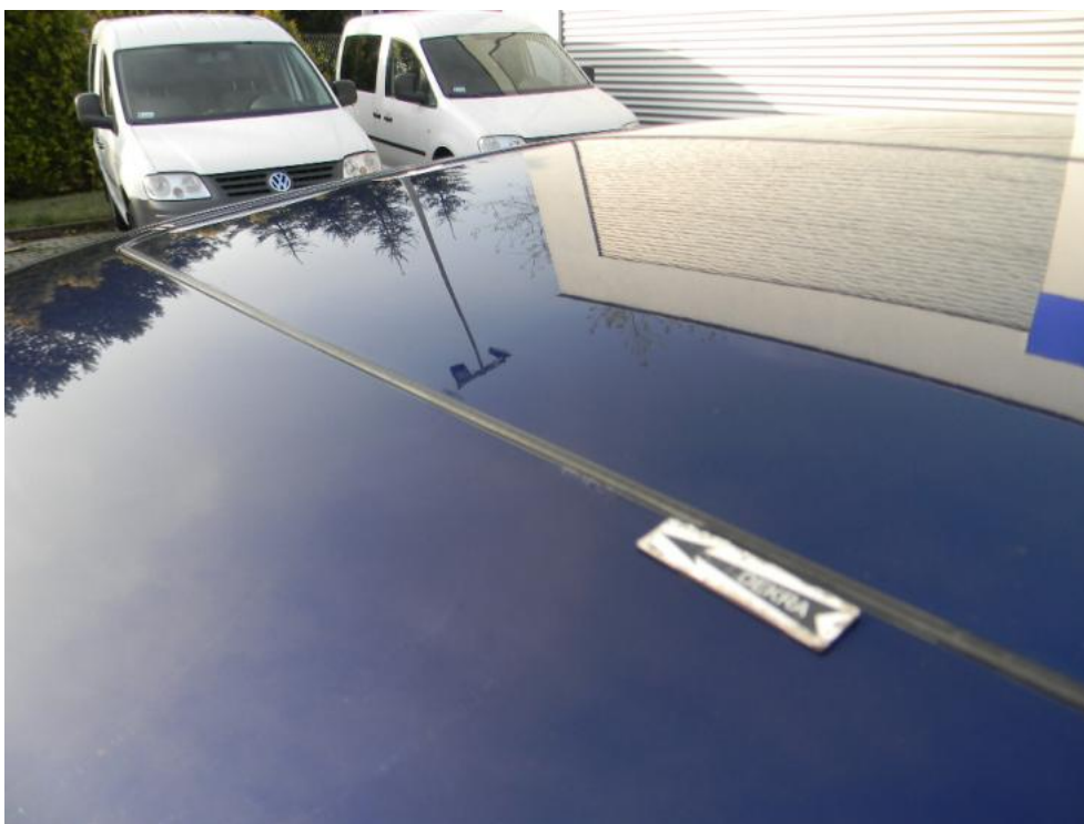
Fot. 31. uszczelka szyby P