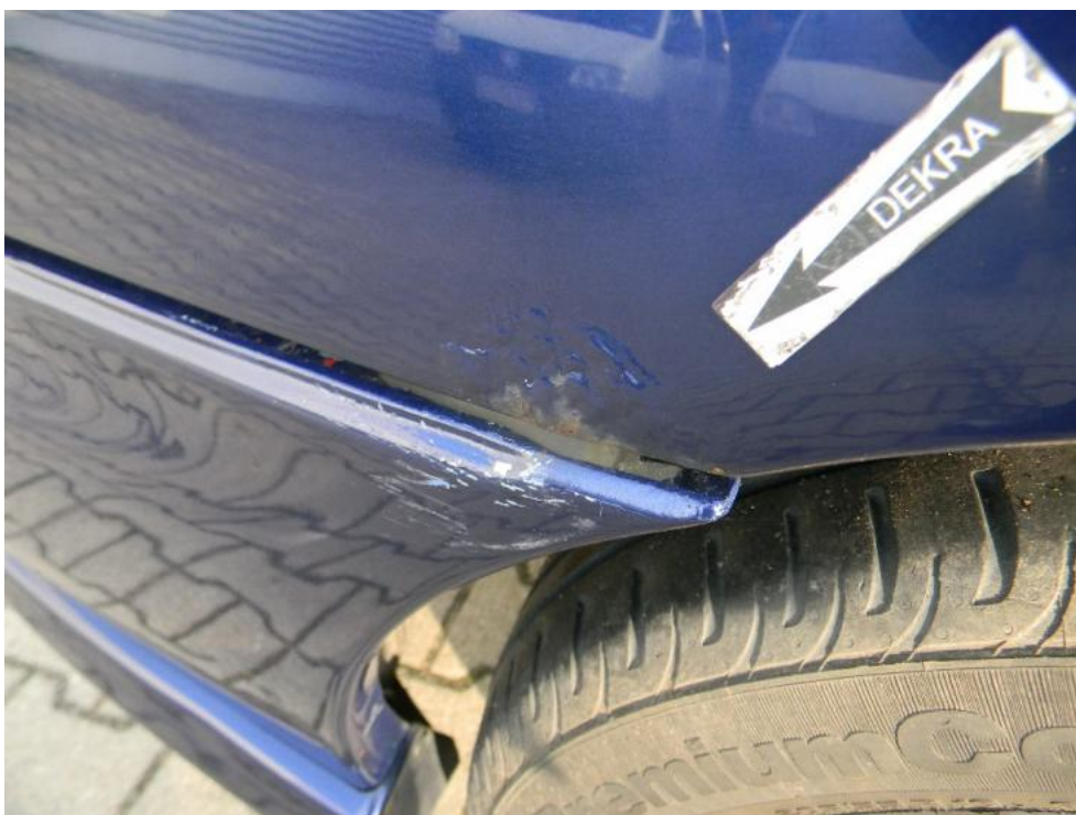
Fot. 26. błotnik TP