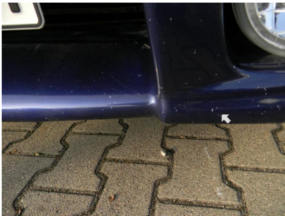
Fot. 22. zderzak P