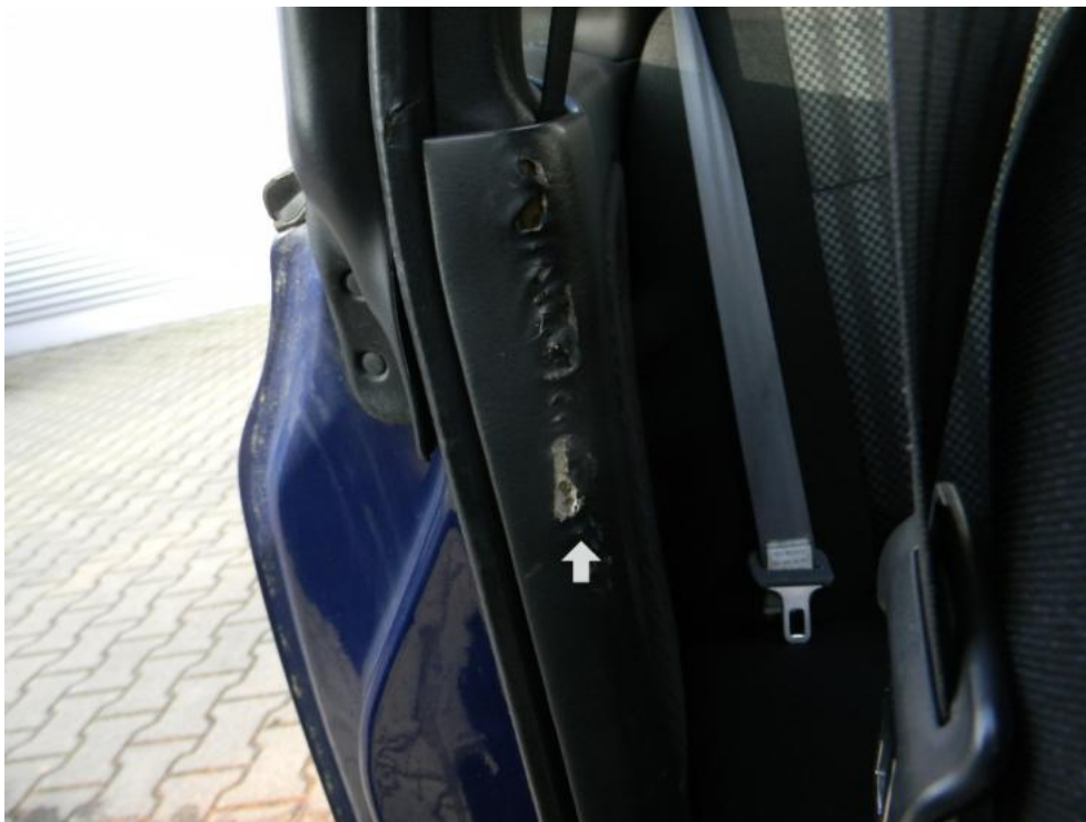
Fot. 15. boczek tapicerski błotnika TP