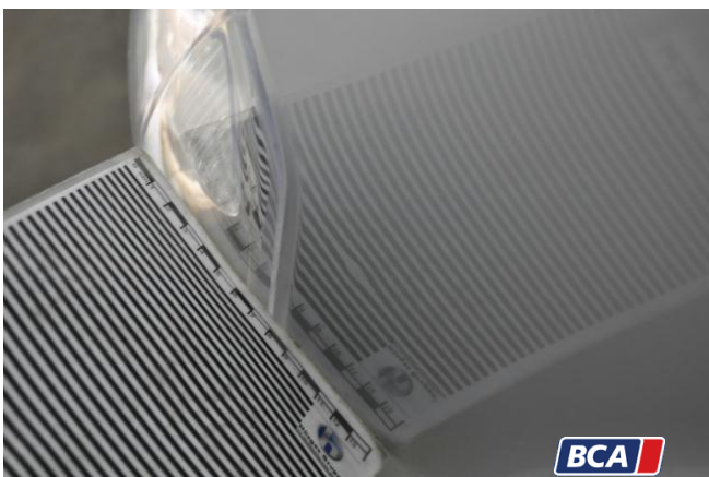
4. Kotflügel - Vorne - Links Hagelschaden