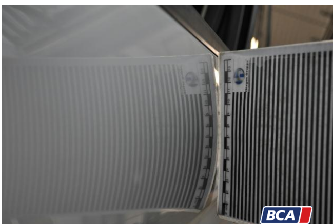
6. Tür - Vorne - Links Hagelschaden