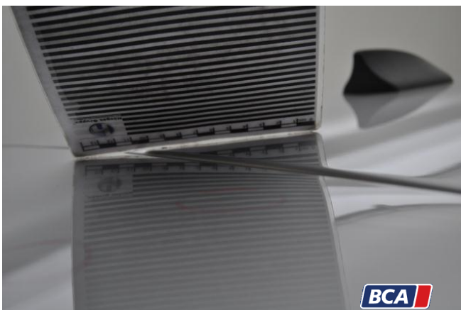
16. Heckdeckel - Hinten Hagelschaden