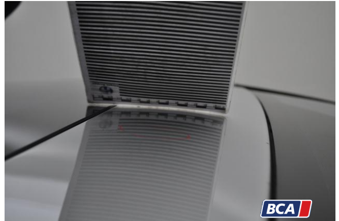
9. Dach Hagelschaden