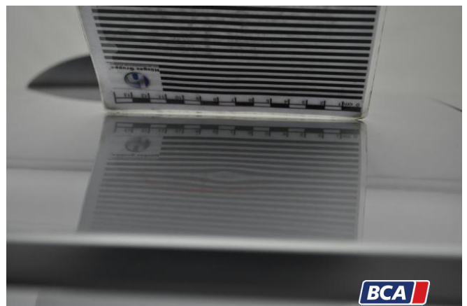
11. Dach Hagelschaden