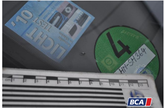
3. Windschutzscheibe - Vorne Steinschlag