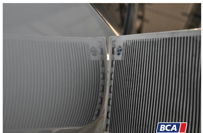
7. Tür - Hinten - Links Hagelschaden