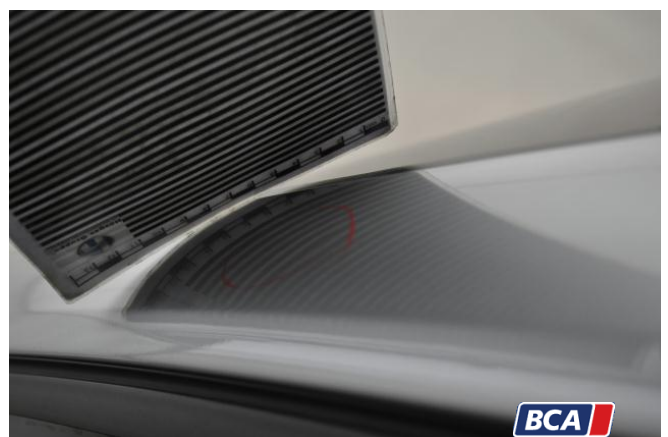
13. Dachrahmen Hagelschaden