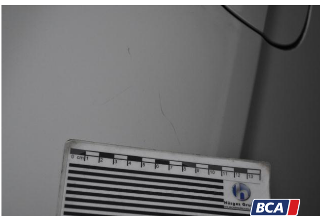
18. Seitenwand - Hinten - Rechts Kratzer