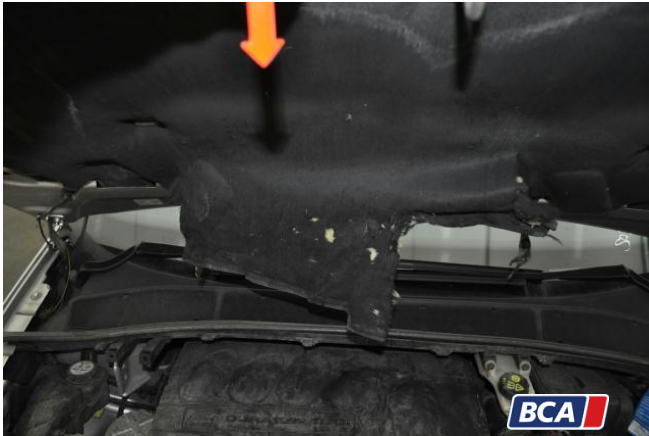
20. Dämmmatte Beschädigt

Hüsge Gruppe ® KFZ-SACHVERSTÄNDIGEN-ZENTRALE