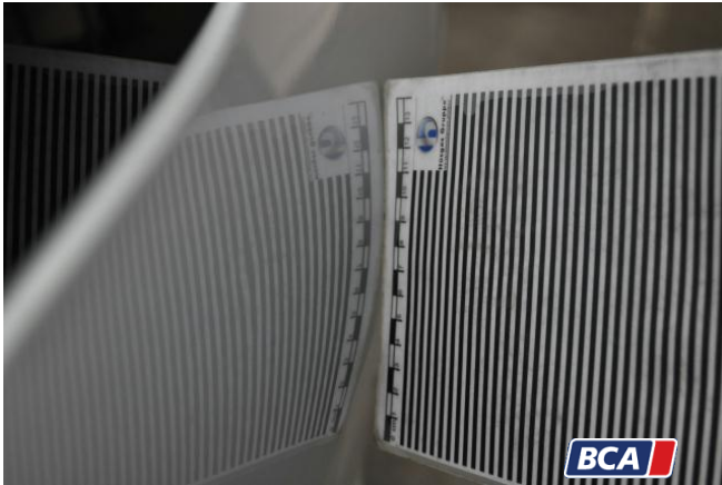
8. Seitenwand - Hinten - Links Hagelschaden

Hüsches Gruppe ® KFZ-SACHVERSTÄNDIGEN-ZENTRALE