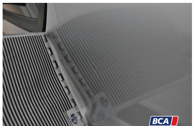
19. Kotflügel - Vorne - Rechts Hagelschaden