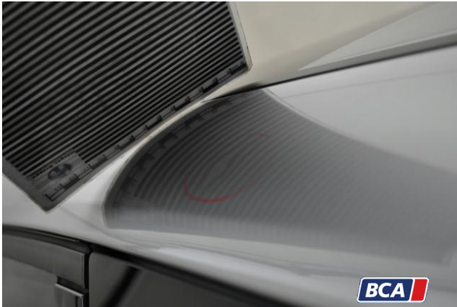
14. Dachrahmen Hagelschaden

Hüsge Gruppe ® KFZ-SACHVERSTÄNDIGEN-ZENTRALE