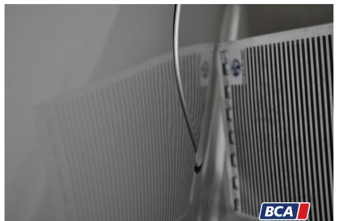
17. Seitenwand - Hinten - Rechts 2 Dellen