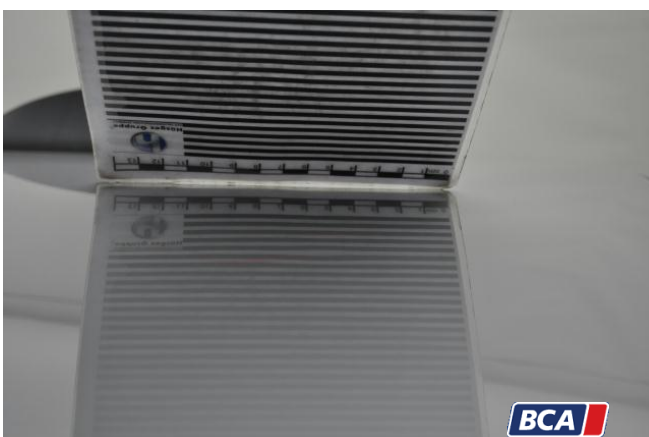
12. Dach Hagelschaden