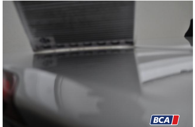
15. Heckdeckel - Hinten Hagelschaden