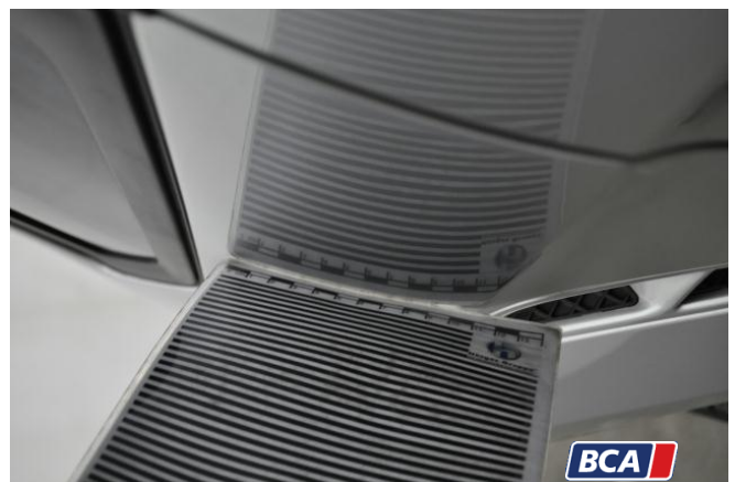
5. Kotflügel - Vorne - Links Hagelschaden