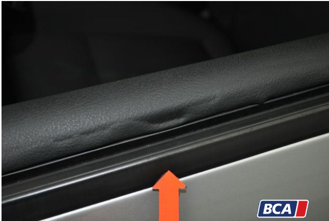
2. Tür - Vorne - Links : Verkleidung Beschädigt

Hüsches Gruppe ® KFZ-SACHVERSTÄNDIGEN-ZENTRALE