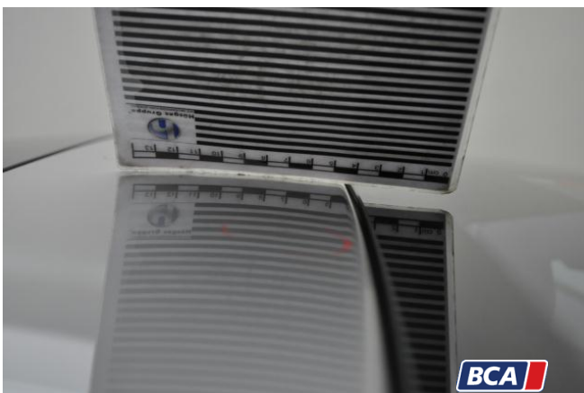
10. Dach Hagelschaden